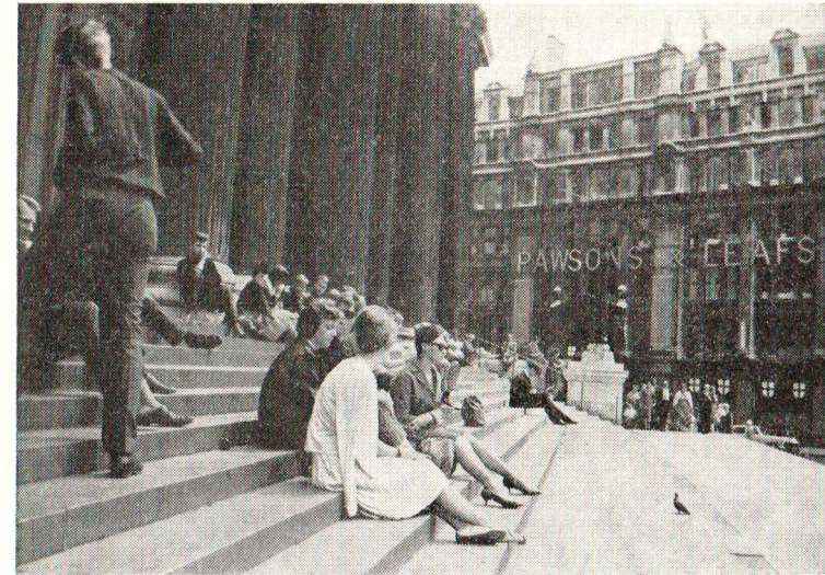
På trappen til St. Paul's

Fra Skotland gik turen videre ned gennem The Lake District, og vi nåede til Stratford-upon-Avon, hvor vi om aftenen så et Shakes-